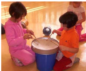
giochi in un laboratorio musicale La pratica musicale come momento educativo si è largamente divulgato anche tra i piccolissimi

Una ricerca recente della University of California ha dimostrato quanto il canto collettivo accresca la capacità spaziale del ragionamento migliorando l'intelligenza necessaria per comprendere materie quali la matematica e le scienze, inoltre sviluppa le capacità sensoriali e la creatività.