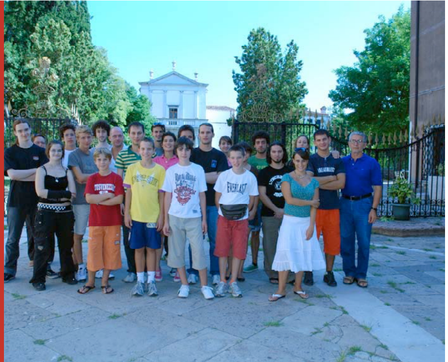
Seminario di Studi Chitarristici, Agosto 2008